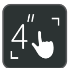
Écran tactile LCD