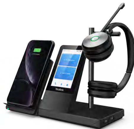
WH66 avec chargeur * Le chargeur sans fil est en option