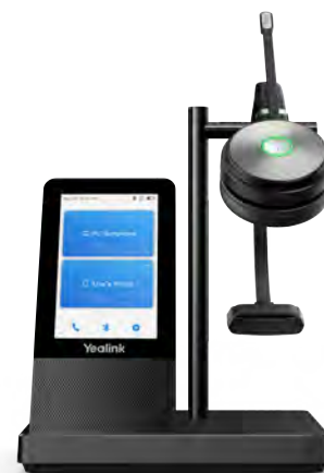
WH66 Mono/Dual: Teams WH66 Mono/Dual: UC