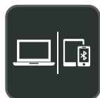
Connexion à plusieurs appareils