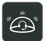
Technologie Acoustic Shield

Le Yealink WH66 est le casque sans fil DECT leader du secteur. Avec les modèles WH66 Dual et WH66 Mono, il offre une toute nouvelle forme de collaboration de bureau. Parfaitement compatible avec les plates-formes de communications unifiées, il s'intègre en mode natif avec les téléphones IP Yealink. L'écran tactile capacitif de 4,0 pouces (480 × 800) de la base offre une nouvelle expérience de travail, pour tout contrôler d'une simple pression. Il joue le rôle de poste de travail, gérant les appels téléphoniques, se connectant à plusieurs appareils (téléphone de bureau/téléphone mobile/ordinateur), chargeant les téléphones mobiles sans fil, et jouant même le rôle de haut-parleur. Cerise sur le gâteau, cette station de travail multifonctionnelle fonctionne directement dès que vous la branchez. Les choses deviennent plus simples, avec un plus grand confort pour l'utilisateur.