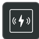
Chargeur sans fil Qi