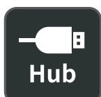
Concentrateur USB intégré