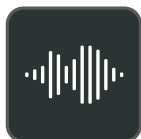
Expérience audio Optima